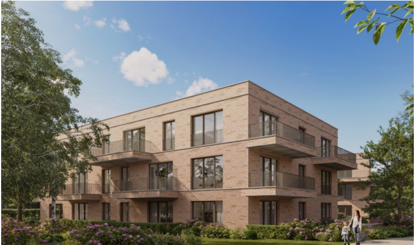
Sint-Amands | Appartement | € 216.500

Het project is gelegen in de Emile Verhaerenstraat – Jan Van Droogenbroeckstraat te Puurs-Sint-Amands. Het centrum van het pittoreske Sint-Amands ligt op wandelafstand. Je hebt er alles binnen handbereik. Bakkers, beenhouwers, supermarkten. Ontspannen kan je langs de oevers van de Schelde of in één van de vele lokale sportclubs. Met enkele leuke restaurants in de buurt, kan je ook de inwendige mens makkelijk verwennen. Je hebt er bovendien een bushalte die verplaatsingen onder meer naar Puurs Station zeer eenvoudig maken. Puurs Station is ook trouwens per fiets makkelijk bereikbaar. Met een kinderdagverblijf en verschillende scholen op wandelafstand, is er ook aan de allerkleinsten gedacht. Ook met de auto ben je snel weg. "De tuin van Emile" ligt op 10 km van de oprit van de E17 waarmee je een rechtstreekse verbinding hebt naar onder meer Gent, Sint-Niklaas en 7 km naar het knooppunt A12 in Breendonk richting Brussel of Antwerpen. Puurs-Sint-Amands heeft een nieuw masterplan voor de Scheldekaaien en omgeving uitgewerkt waardoor het er nog aangenamer vertoeven wordt. Het krijgt het 'BEN' label, bijna-energieneutraal met een E-peil onder de 20. Voor info en verkoop, neem vrijblijvend contact op op nummer 052/33.26.86 of mail naar gert@ax-quality.be