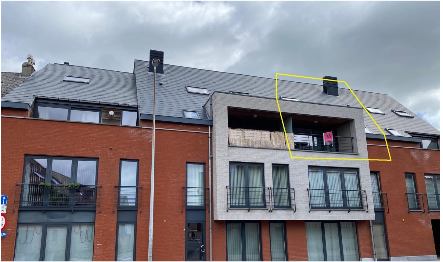
Lebbeke | Appartement | € 760

Recente duplex (110 m 2 ) met 2 slaapkamers en 2 badkamers, terras en ruime garage. Op de tweede verdieping bevinden zich een inkomhal met toilet, een berging/wasplaats, een ruime living met open keuken, een slaapkamer op het niveau van de lift met en suite een badkamer en een terras aansluitend aan de living. Op de duplexverdieping bevinden zich een tweede toilet, een ruime slaapkamer met ensuite een douchekamer, een wasplaats en een tweede berging/eventueel babykamer. Alle modern wooncomfort! Ruime garage! Nabij het centrum van Lebbeke. Lift aanwezig. Geen huisdieren toegelaten volgens het reglement van inwendige orde en de basisakte. huurprijs incl. garage 760€ + 50 € maandelijkse lasten. Vrij vanaf 01/11. EPB: 101,12 kWh/m 2 /j, E-peil: 72, aangiftenr.EPB: 42011-6-2008_189/EP02409/A001/D01/SD013.