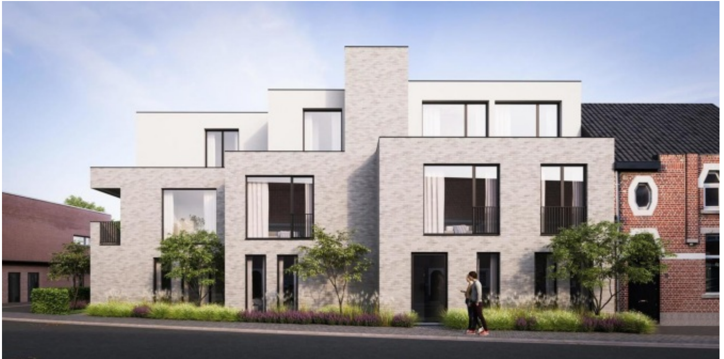
Sint-Amands | Appartement |

In het charmante en landelijke Sint-Amands nabij de Schelde met prachtige wandel- en fietsroutes wordt deze exclusieve kleinschalige residentie Ter Heide gerealiseerd. Dit project biedt een unieke woonervaring op een uitstekende locatie, op wandelafstand van scholen, winkels en openbaar vervoer. De strakke gevel van het gebouw springt meteen in het oog en weerspiegelt de moderne architectuur. Residentie Ter Heide bestaat uit 7 stijlvolle appartementen en beschikt over 11 ondergrondse autostaanplaatsen. Daarnaast biedt de ondergrondse parking een praktische fietsenberging en afvalberging. De appartementen zijn ontworpen met een focus op duurzaamheid en energie-efficiëntie. Met bijna-energie neutrale kenmerken voldoen ze ruimschoots aan de huidige energienormen. Het gebruik van vloerverwarming, een ventilatiesysteem type D, zonnepanelen, super-isolerende beglazing en hoogwaardige thermische en akoestische isolatie zorgen voor optimaal wooncomfort. Elk appartement beschikt over een ruim terras, terwijl de gelijkvloerse units bovendien een prachtige tuin hebben. De afwerking is van topkwaliteit en tot in de kleinste details verzorgd. Bewoners krijgen de mogelijkheid om de inrichting naar eigen smaak te kiezen, wat bijdraagt aan een persoonlijk en comfortabel thuisgevoel. De oplevering is voorzien uiterlijk midden 2025. Voor info en verkoop, neem vrijblijvend contact op op nummer 052/33.26.86 of mail naar gert@ax-quality.be